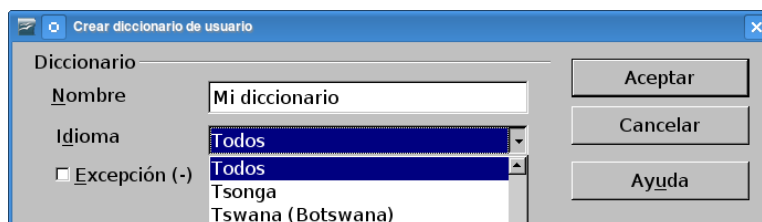
Figura 1: Creación de un nuevo diccionario en OpenOffice.org